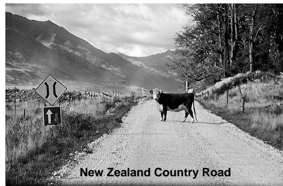
New Zealand Country Road

So richtig gerade schnelle Strassen gibt es in Neuseeland eher nicht, aber als Morris braucht man das auch gar nicht, oder ? Am liebsten war ich immer in den wop wops unterwegs (hier würde man wohl sagen: im Hinterland oder am A... der Welt) und am besten haben mir immer die einspurigen Brücken gefallen – da gibt es eine, über die fahren Züge, Autos, Fahrräder und alles andere (aber nicht unbedingt gleichzeitig - der Zug hat immer Vorfahrt). Das war meine Welt !