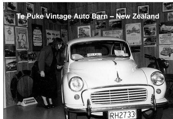
Te Puke Vintage Auto Barn – New Zealand