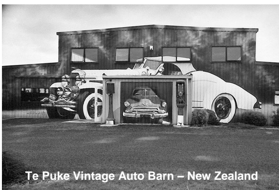
Te Puke Vintage Auto Barn – New Zealand

Von mir aus hätte das ewig so weitergehen können - eines Tages jedoch bekam mein Besitzer eine schwere Midlife Crisis und bildete sich ein, er müsste unbedingt ein neomodisches japanisches Auto mit elektrischen Fensterhebern und diesem ganzen Quatsch haben. Und so kam es, dass ich mit kaum 39 Jahren ins Altersheim abgeschoben wurde – was für eine bodenlose Frechheit!