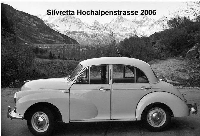
Silvretta Hochalpenstrasse 2006

Ich fahre auch gerne in die Berge, aber meistens lassen sie mich nicht, angeblich, weil ich zu schwach bin, obwohl ich das für bullshit halte. Da nehmen meine Besitzer dann lieber die Giulia. OK, die ist schon schneller - aber warum soll immer nur sie den ganzen Spaß haben?